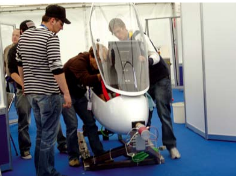
Schüler präsentieren bei »Jugend forscht« innovative Ideen.