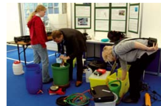
Schüler bauen ihren Stand für den Bundeswettbewerb auf.

Ansprechpartner stehen für Gespräche zur Verfügung