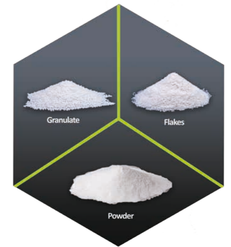
Spektrum an SUMFOAM®- Körnungen: Pulver, Flakes und Granulat

Der neuartige Werkstoff bietet Potenzial für gänzlich neue und nachhaltige Materiallösungen in diversen Anwendungen. Seine hydrophoben Eigenschaften ermöglichen es, den Schaum auch als Absorber für unpolare Substanzen einzusetzen. So ist er in der Lage, das Siebenfache seines Eigengewichts an Öl aufzunehmen und kann als Ölbindemittel bei Umweltkatastrophen oder auch als Trägermaterial für flüssige Chemikalien in der chemischen Prozessindustrie eingesetzt werden. Weitere Einsatzfelder, wie beispielsweise in den Bereichen Leichtbaukonstruktion, Filtrationstechnologie, 3D-Druck oder auch in feinstvermahlener Form als Zuschlagstoff, zeigen zusätzlich vielversprechende Ergebnisse.