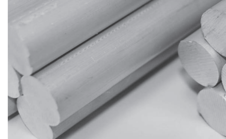
Mit Zentallium hat die Zoz Group einen innovativen metallischen Leichtbauwerkstoff entwickelt