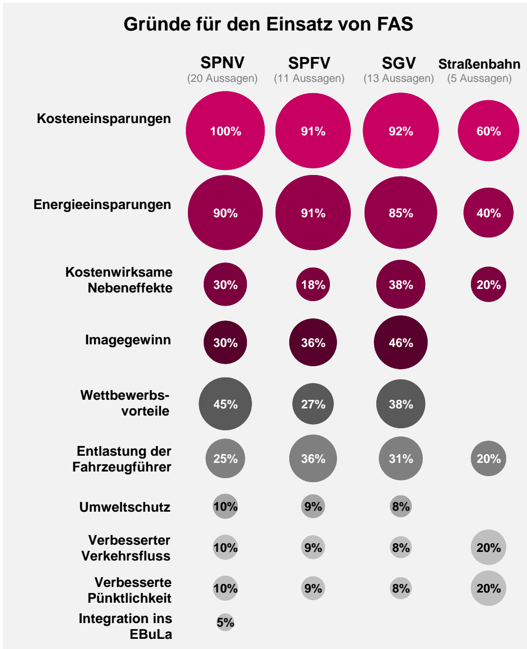
Abbildung 2: Von Teilnehmern der Online-Umfrage genannte Gründe, warum in ihren Unternehmen Fahrerassistenzsysteme eingeführt werden sollen bzw. eingeführt wurden.