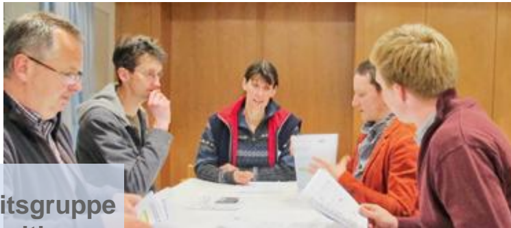
DMK-Arbeitsgruppe „Nachhaltige Milchwirtschaft“