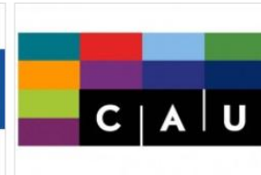
CHRISTIAN-ALBRECHTS-UNIVERSITÄT ZU KIEL