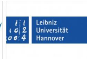
LEIBNIZ UNIVERSITÄT HANNOVER