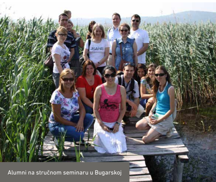
Alumni na stručnom seminaru u Bugarskoj

Stipendija počinje uvodnim seminarom za sve nove stipendiste u Oznabriku, gde se razjašnjavaju važna organizaciona pitanja vezana za boravak u Nemačkoj. Nakon toga sledi intenzivni kurs nemačkog jezika koji traje nekoliko sedmica i odvija se u takođe u Oznabriku. DBU prati, pruža podršku i nadgleda stipendiste tokom celog perioda stipendiranja. Na seminarima stipendisti prezentuju svoje teme i rezultate i imaju priliku za međusobno povezivanje i umrežavanje. Sopstvena inicijativa u organizaciji dodatnih stručnih seminara, okupljanja, i sastanaka je veoma dobrodošla i podržana od strane DBU-a.