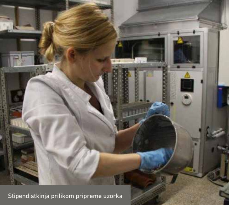
Stipendistkinja prilikom pripreme uzorka