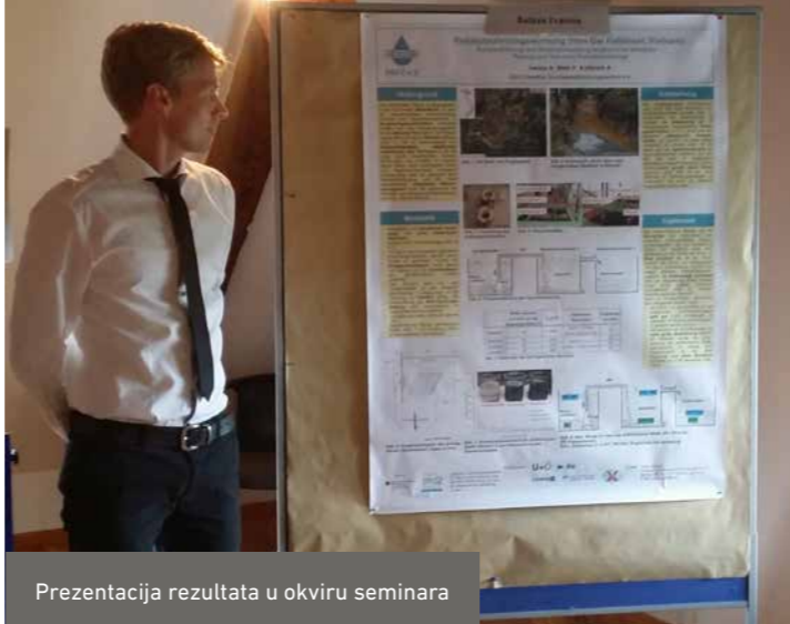
Prezentacija rezultata u okviru seminara

Stipendisti se obavezuju da redovno učestvuju na seminarima stipendista, da podnose izveštaje, da ažuriraju svoje podatke i profil na online komunikacijskoj platformi (Stipnet), da unaprede svoje znanje nemačkog jezika i da prijave eventualne (neželjene) promene relevantne za finansiranje. Za realizaciju projekta u Nemačkoj nije potrebna radna dozvola. Međutim, za ulazak u Nemačku (duži od 90 dana) potrebna je viza za određene zemlje, u koje spada i Srbija. Nosioци stipendija dostavljaju svoje prijave za vizu blagovremeno ambasadi Republike Nemačke u matičnim zemljama.