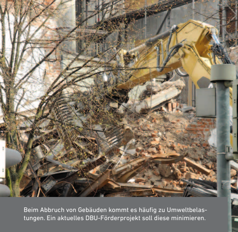
Beim Abbruch von Gebäuden kommt es häufig zu Umweltbelastungen. Ein aktuelles DBU-Förderprojekt soll diese minimieren.