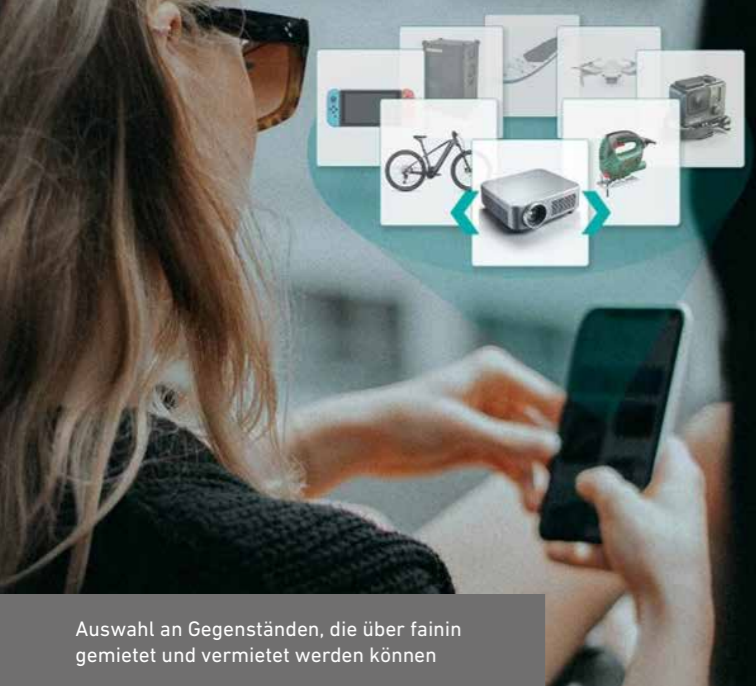
Auswahl an Gegenständen, die über fainin gemietet und vermietet werden können