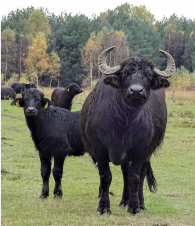
Wasserbüffel eignen sich gut für nasse Flächen oder wenn es um die Offenhaltung von Gewässern geht.

schnell verfetten und ernsthafte gesundheitliche Probleme bekommen können. Grundsätzlich können auch Kreuzungen verschiedener Rassen eingesetzt werden. Wasserbüffel eignen sich beispielsweise gut für nasse Flächen und wenn es um die Offenhaltung von Gewässern geht (KTBL E. V. 2010). Dabei haben sich die ursprünglich aus den rumänischen Karpaten stammenden Linien als besonders geeignet herausgestellt. Sie können in den meisten Regionen ganzjährig im Freiland gehalten werden.